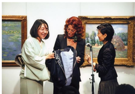
右が伊東香織市長、中央がソフィアローレン